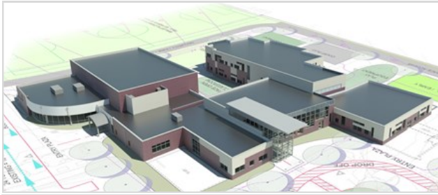
Prestación del Exterior de Hudson: Dando Frente al Sudeste