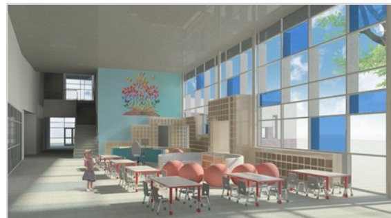
Representación del interior de Hudson: Orientación sur en el Media Center.