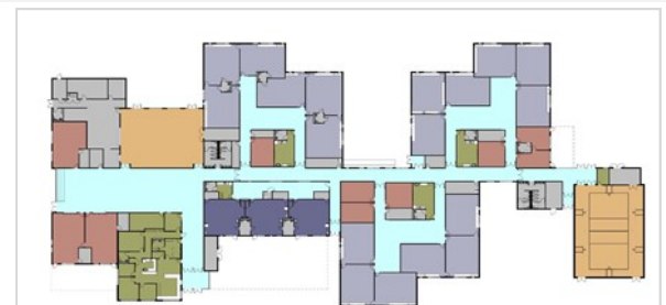
Nueva Primaria Lochbuie Plan de Piso