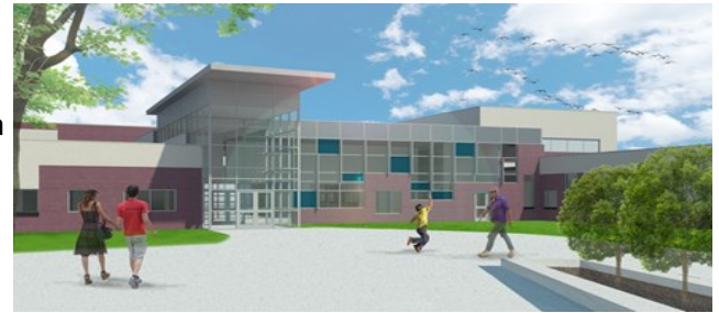
Entrada Principal de la Escuela Primaria Hudson

En marzo se realizaron dos reuniones comunitarias donde se describió el proceso de diseño de la escuela y se mostraron las imágenes exteriores e interiores de la escuela primaria renovada de Hudson y la nueva escuela primaria en Lochbuie. Para ambos proyectos, los diseños esquemáticos han sido completados y los arquitectos están trabajando en el Desarrollo del Diseño (DD). La siguiente fase será la Documentación de Construcción (CD) que se completa antes de comenzar la construcción.