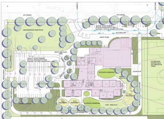
Plan del Sitio para la Escuela Primaria Hudson