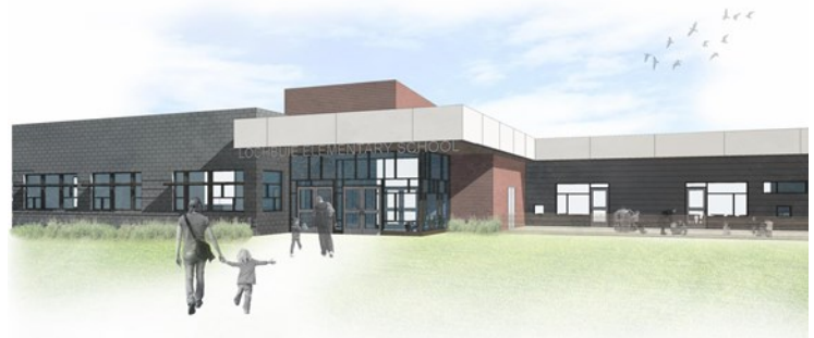
Entrada Principal de la Nueva Primaria Lochbuie