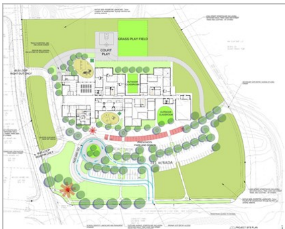
Plan de Sitio para la Nueva Escuela Primaria Lochbuie