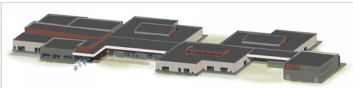
Prestación del Exterior de Hudson: Dando Frente al Norte